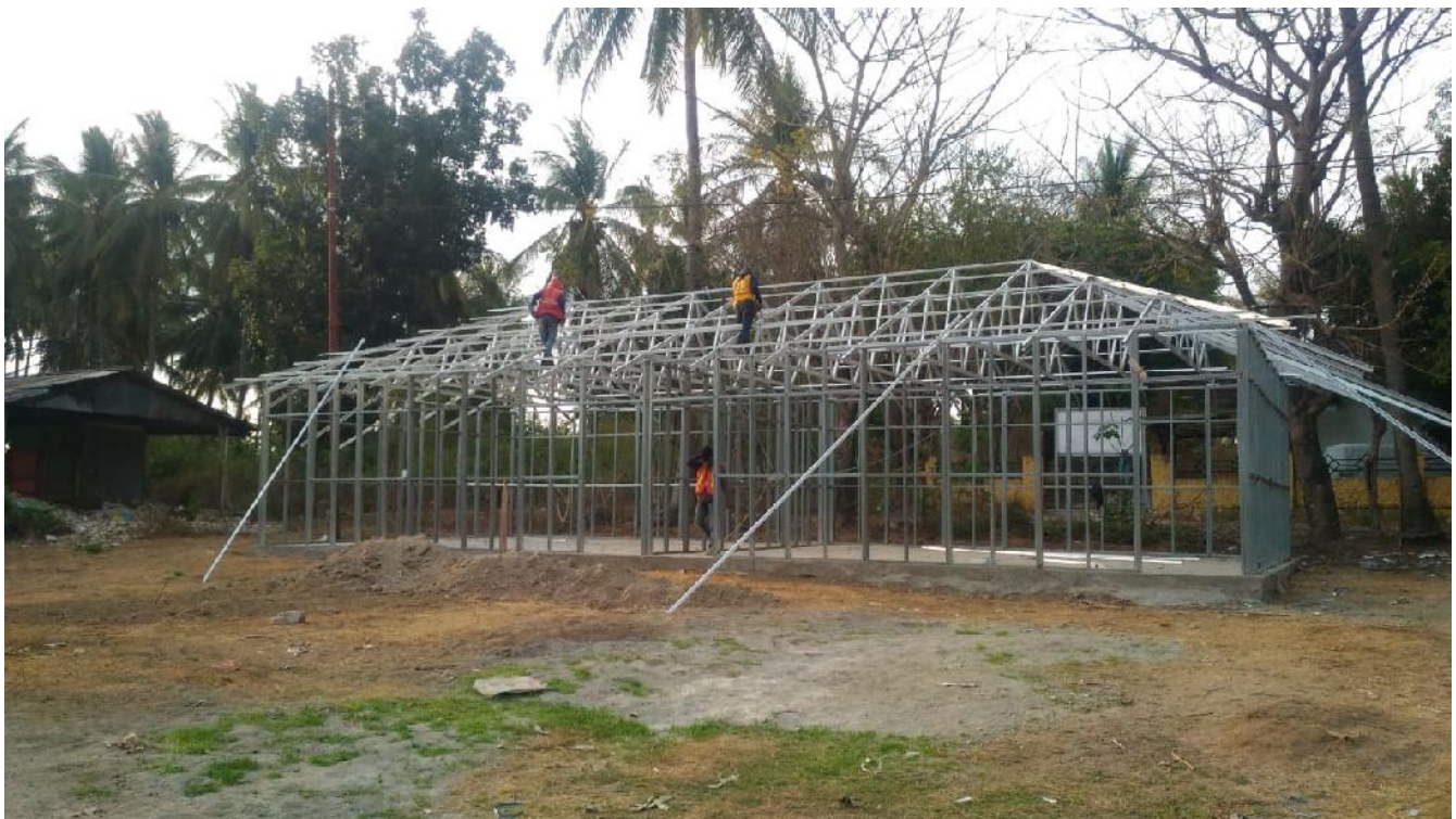
House Frame SD Lombok Utara