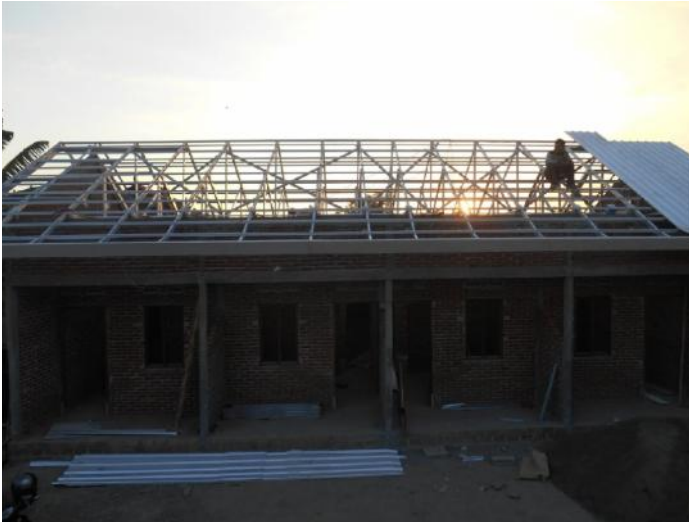
Rumah Kost Bp.Sudipta-Dalung Utara