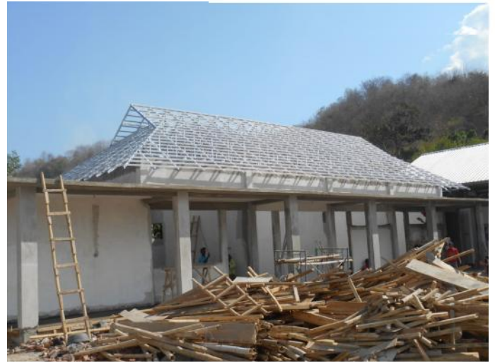
Kantor PU- Lombok Barat