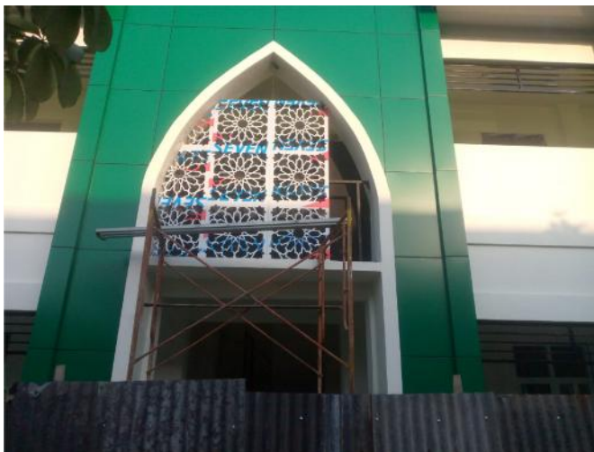
Fasad ACP Masjid Denpasar