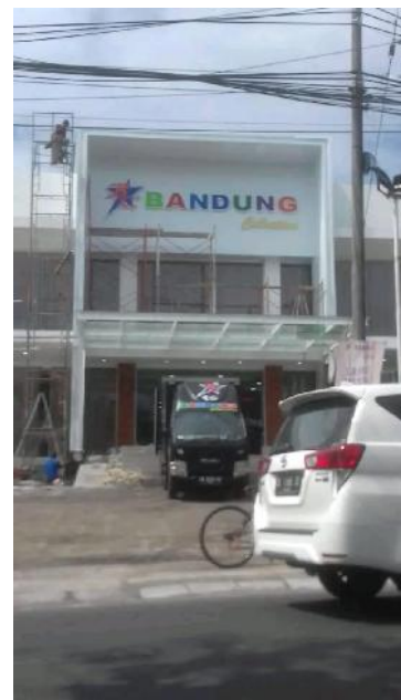
Fasad ACP Bandung Collection Jimbaran