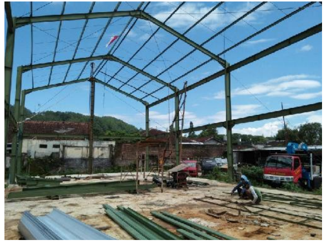
Gudang Sembako-Masbagik Lombok Timur